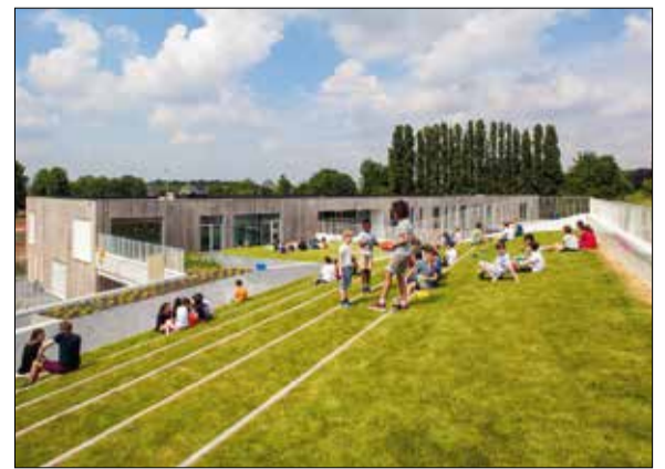
Parkschool, Mortsel - arch. Binst Architects

Met de VKaLCA-tool heeft VK Architects & Engineers trouwens een eigen instrument ontwikkeld waarmee het ontwerpkeuzes screent om de milieuprestatie van een project in elke fase van zijn levenscyclus te optimaliseren.