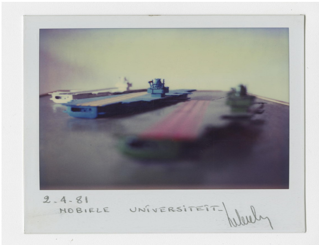
Mobile medium university , 1981. Sabam for Luc Deleu & Top Office

Mobile medium university, 1981. © Sabam for Luc Deleu & Top Office