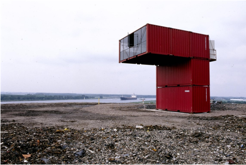
<p>De <i>Orbino</i>, hier in 2002 in Amsterdam, staat nu in het Middelheimpark. <span class="credit">sabam for Luc Deleu & Top Office</span></p>

De Orbino, hier in 2002 in Amsterdam, staat nu in het Middelheimpark. © sabam for Luc Deleu & Top Office