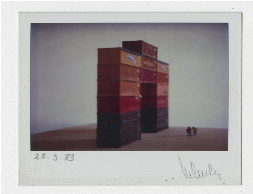
<p>Schaalmodel van een container. <span class="credit">Sabam for Luc Deleu & Top Office</span></p>

Schaalmodel van een container. © Sabam for Luc Deleu & Top Office