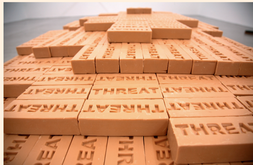
'Threat' geeft je zeep om de angst voor de ander te bestrijden. RV