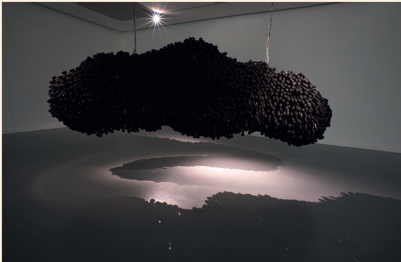
'Singing Cloud' bestaat uit 4.000 micro's die de impact van het bombardement van nieuws op de psyche onderzoeken. RV

De Indiase kunstenaar Shilpa Gupta combineert diepzinnige reflectie met poëtische beeldtaal. In het M HKA in Antwerpen opent vandaag haar eerste overzichtstentoonstelling 'Vandaag zal eindigen'. Een aanrader.