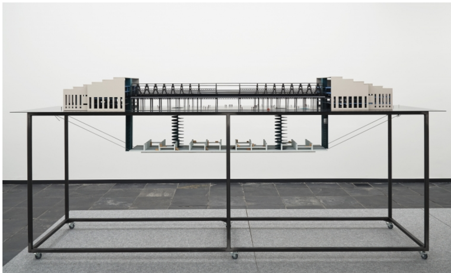
S.M.A.K., Le Musée et Son Double, maquette (1.100), CRIT., 2020

S.M.A.K. in Gent, getiteld "Le Musée et son Double". Daar hebben we met veel reflectie en wikken en wegen de schijnbaar onleegbare puzzel zodanig in elkaar geklikt dat iets wat al 15 jaar vastzat op politiek niveau plotseling bespreekbaar werd. Het was ook een schitterende samenwerking met het S.M.A.K. zelf, we hebben ons allen overtroffen in dit traject. Dat heeft me veel vertrouwen gegeven in wat dat de ruimtelijke discipline in wezen vermag, de vraag écht juist helpen te stellen door architecturaal propositioneel te zijn."