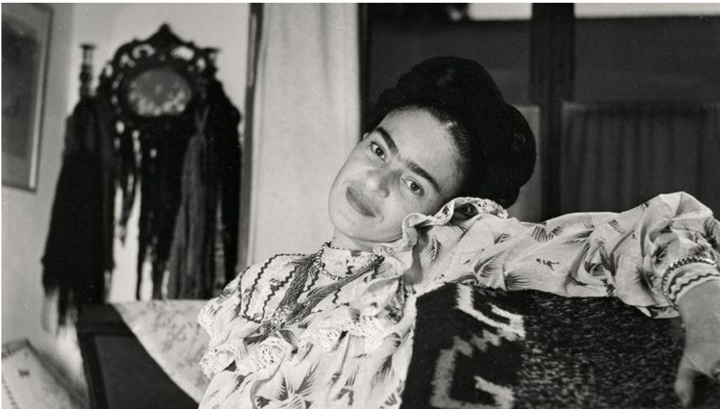
<p>Frida Kahlo. </p>