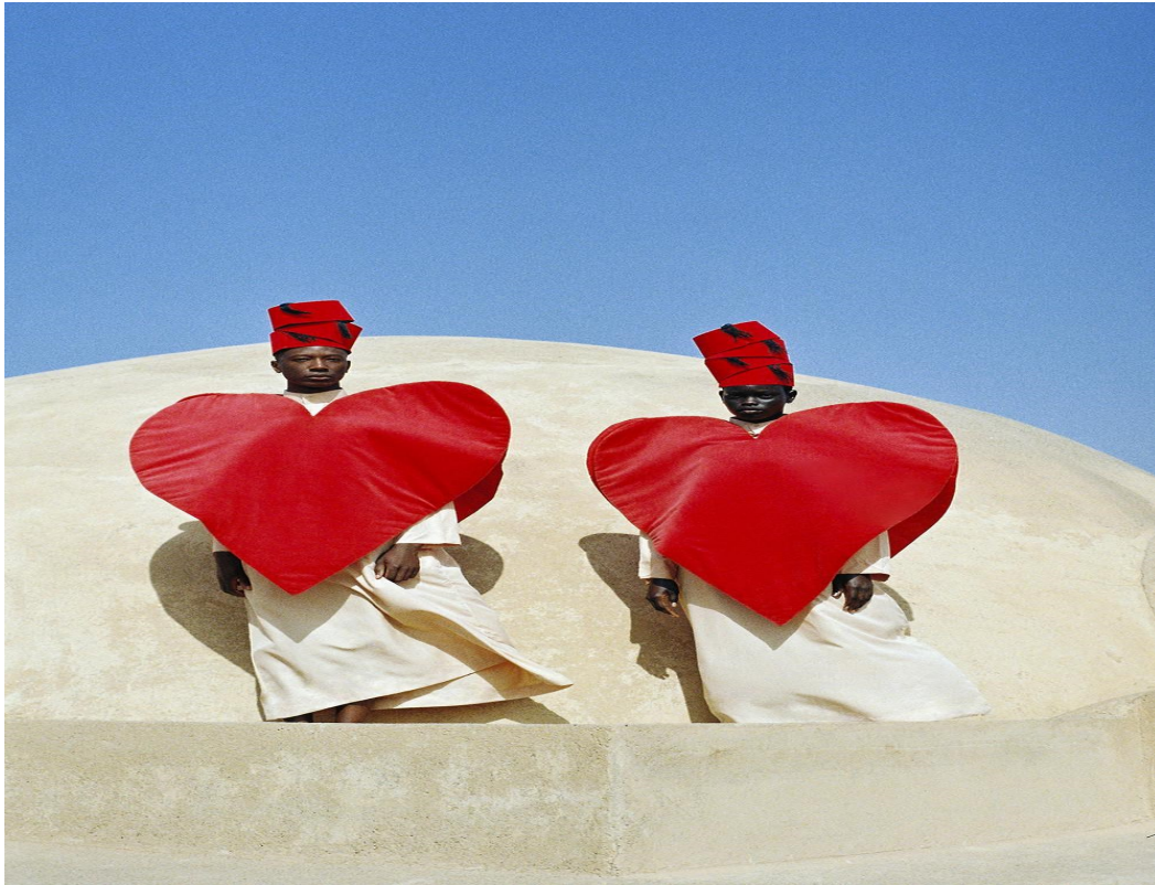
<p>Mous Lamrabat in het Fomu. <span class="credit">Mous Lamrabat/fomu</span> </p>

Mous Lamrabat in het Fomu. © Mous Lamrabat/fomu