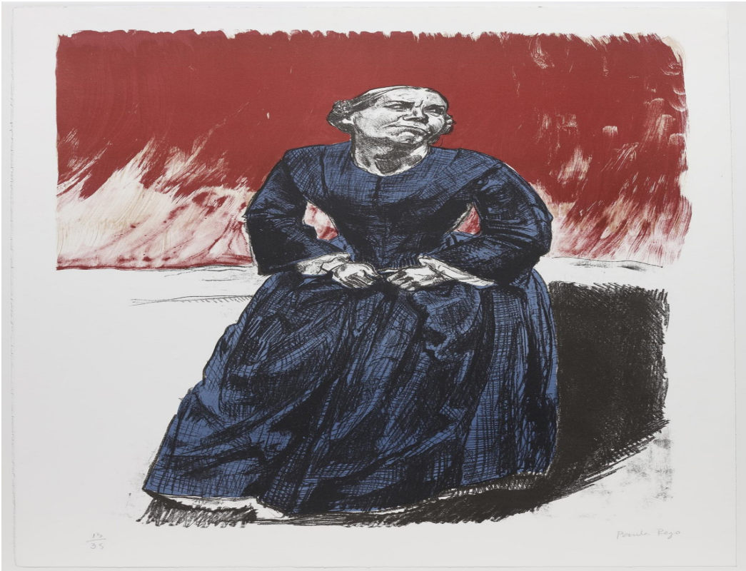
Paula Rego, Come to me . Paula Rego Studio / courtesy Cristea Roberts Gallery

Paula Rego, Come to me . © Paula Rego Studio / courtesy Cristea Roberts Gallery