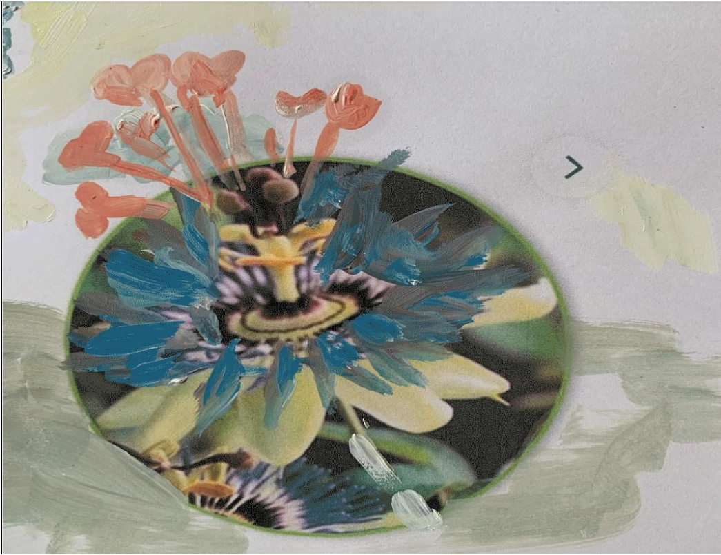
<p><span class="credit">Laure Prouvost</span></p>