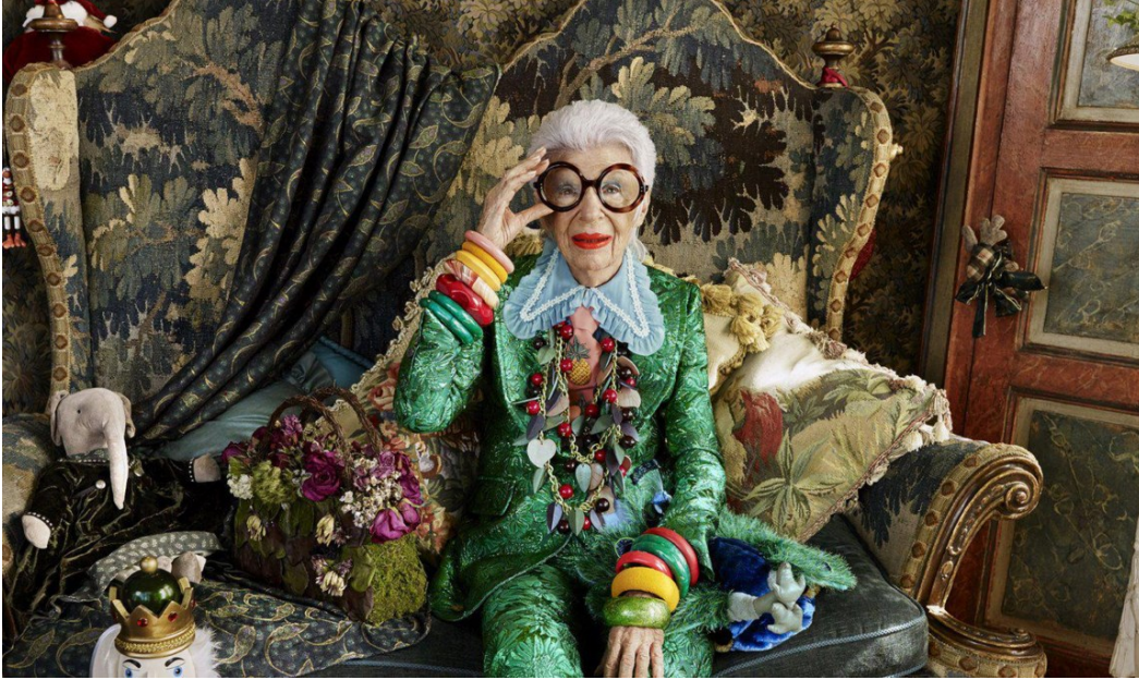
<p>Iris Apfel in <i>Youthquake</i>.</p>