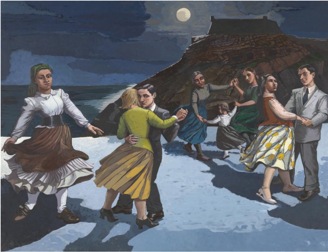
<p><span class="credit">Paula Rego/tate</span></p>