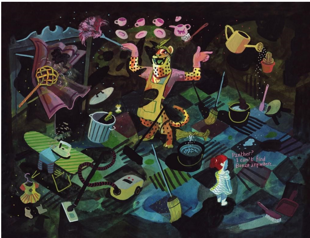
<p><span class="credit">Brecht Evens</span></p>