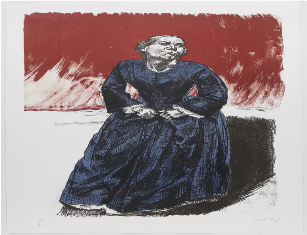
Paula Rego, Come to me.

Paula Rego, Come to me. ©