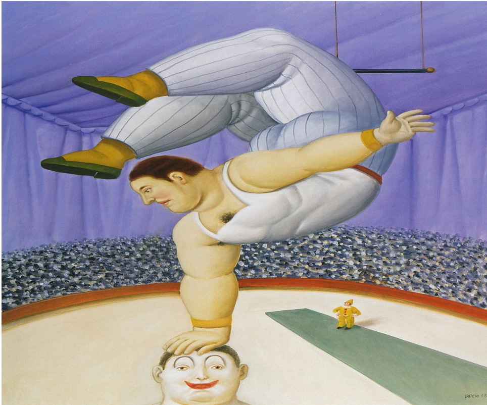
<p><i>Contorsionniste</i> (2008). <span class="credit">Fernando Botero</span></p>

Contorsionniste (2008). © Fernando Botero