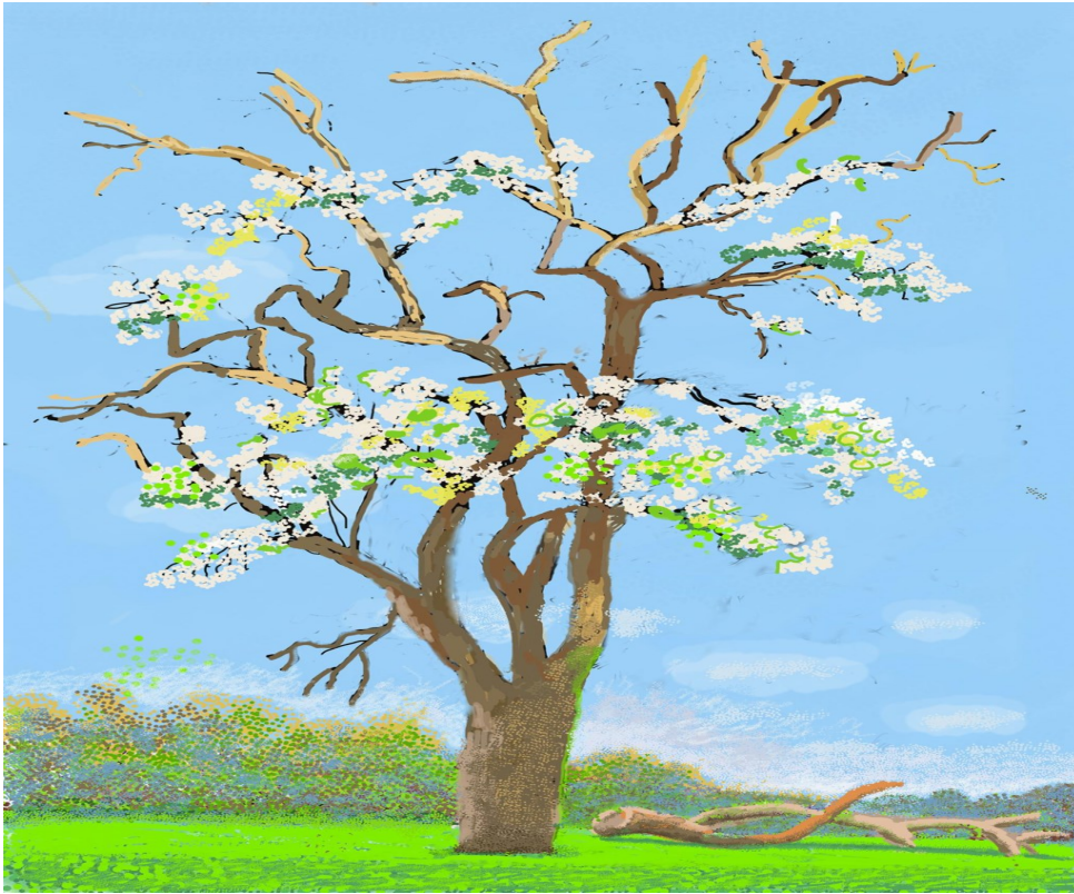
<p><i>No. 147 </i>(2020), iPad-schilderij. <span class="credit">David Hockney</span></p>

No. 147 (2020), iPad-schilderij. © David Hockney