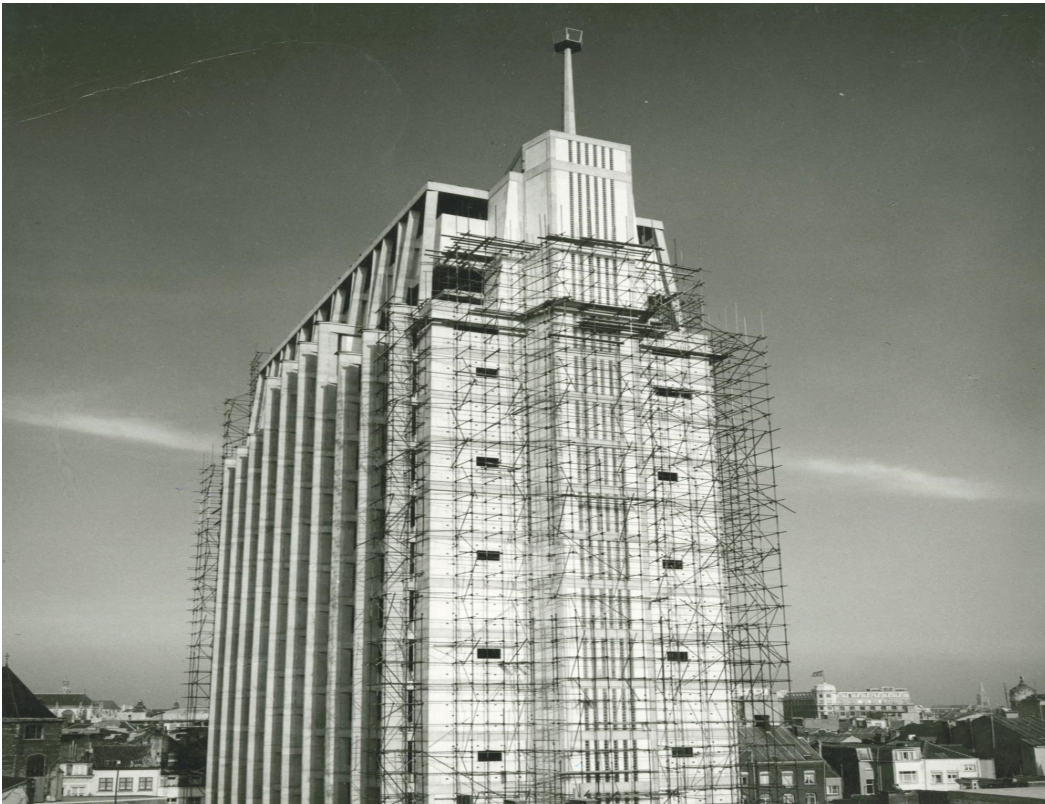
<p class="lijst-link"> <span class="credit">Vlaams Architectuurinstituut</span></p>