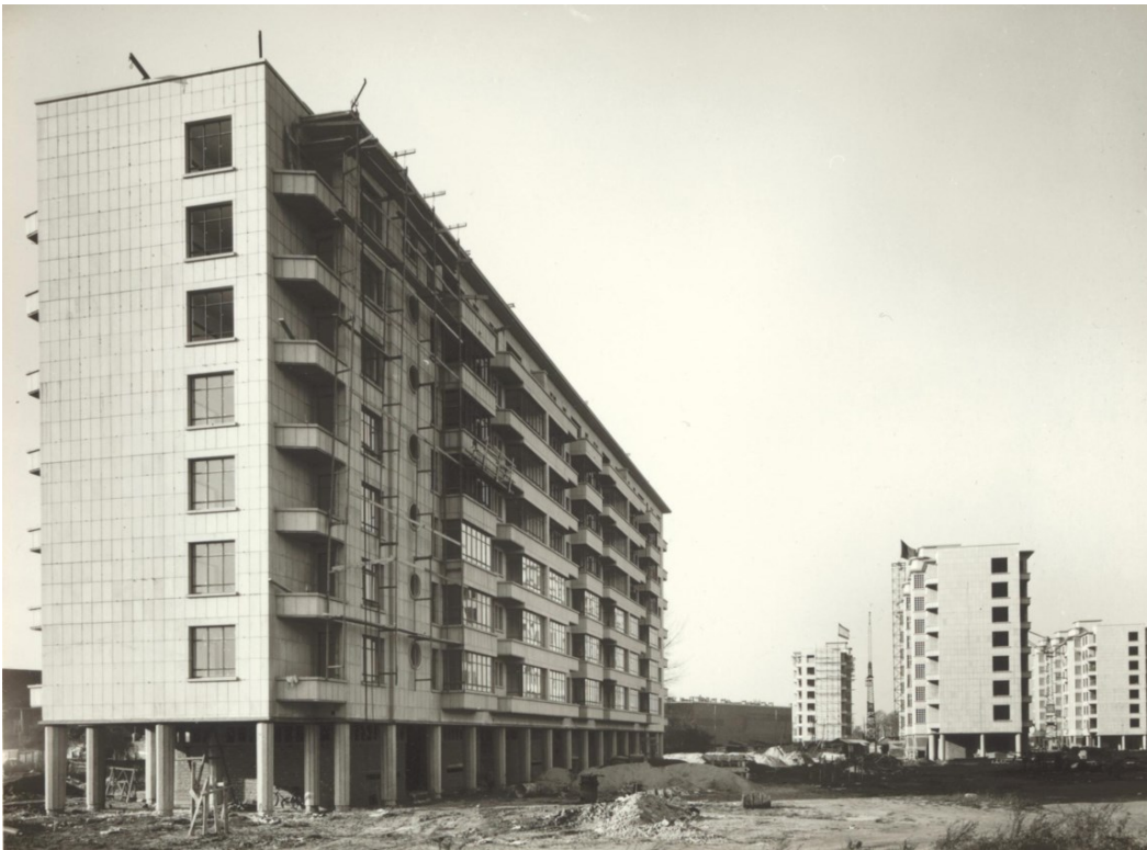
Vlaams Architectuurinstituut – Collectie Vlaamse Gemeenschap, beeldarchief Van Laere.

© Vlaams Architectuurinstituut – Collectie Vlaamse Gemeenschap, beeldarchief Van Laere.