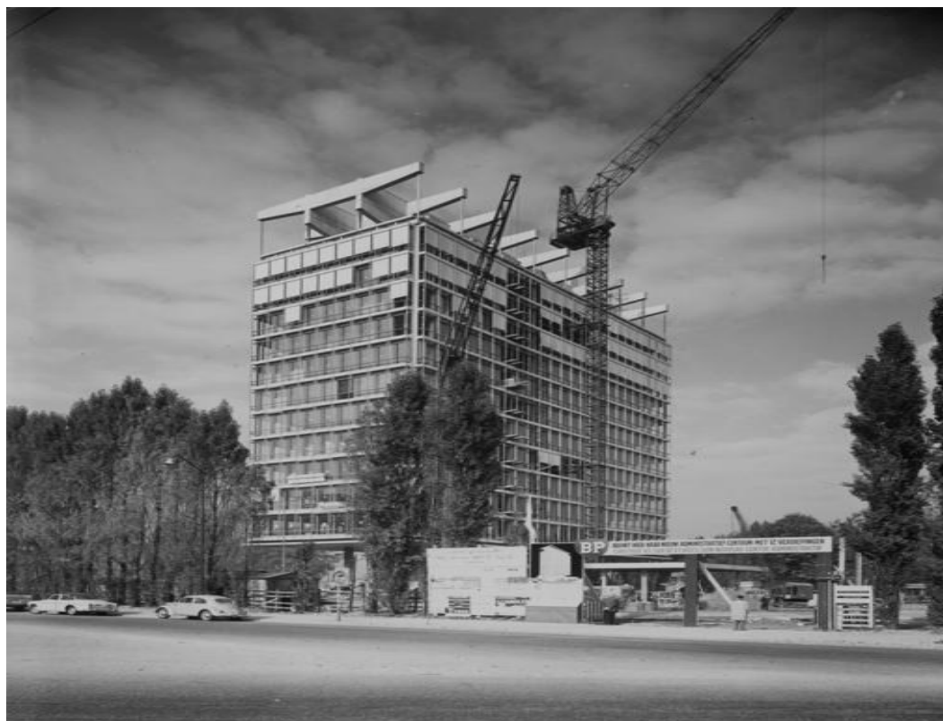
<p class="lijst-link"> <span class="credit">Vlaams Architectuurinstituut – Collectie Vlaamse Gemeenschap, archief Van Coillie</span></p>

© Vlaams Architectuurinstituut – Collectie Vlaamse Gemeenschap, archief Van Coillie