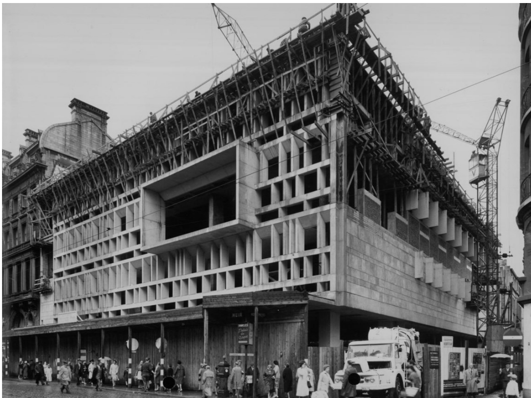
<p class="lijst-link"> <span class="credit">Vlaams Architectuurinstituut – Collectie Vlaamse Gemeenschap, archief Van Coillie</span></p>

© Vlaams Architectuurinstituut – Collectie Vlaamse Gemeenschap, archief Van Coillie