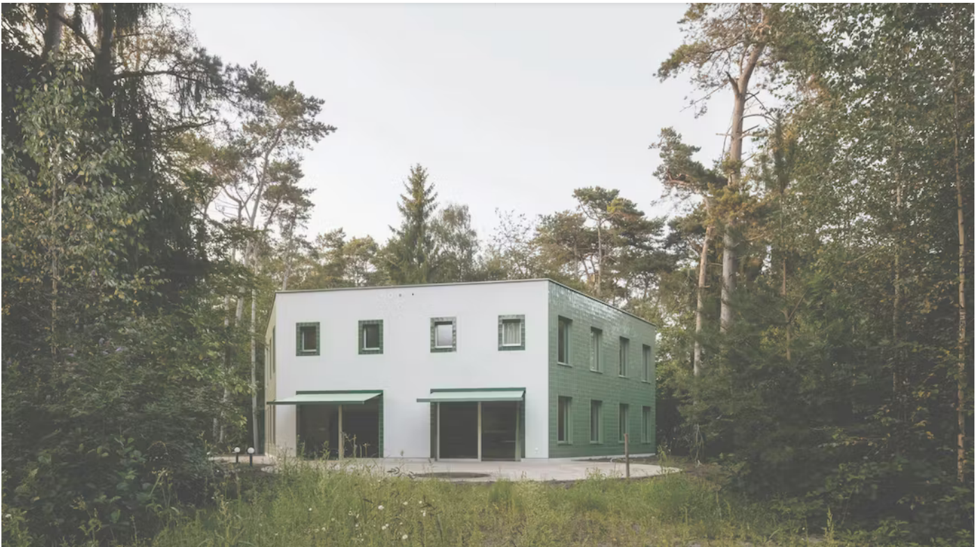
Villa Kameleon door Felt in Monnikenheide.