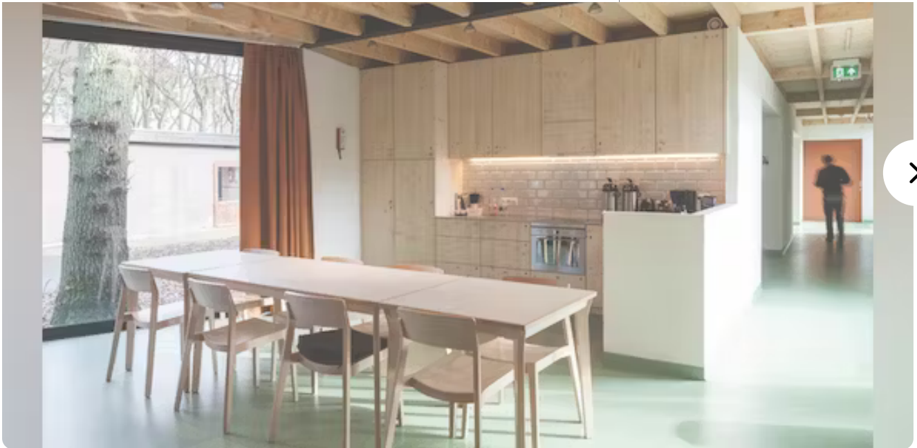
De Eiken door UR architects.