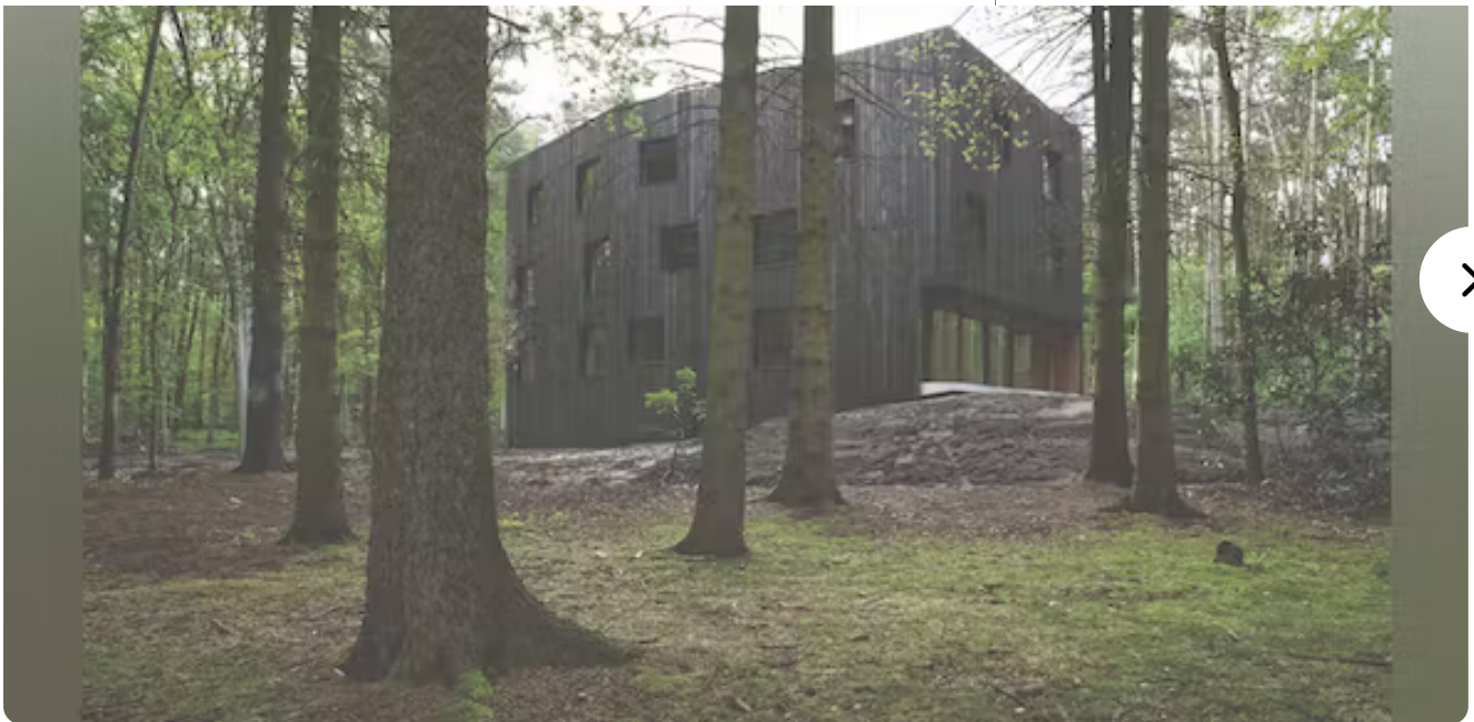
Huis aan de laar door 51n4e.