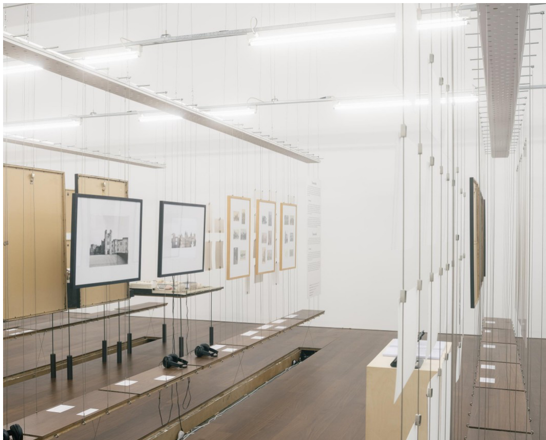
Het bureau Felt creëert ritme in de opstelling.

Het VAI heeft zeven thema's uitgekozen die het als 'experimenten' omschrijft. Sofie De Caigny: 'De opleidingen geven vaak nog een wetenschappelijke en rechtlijnige aanpak mee, maar de praktijk vraagt dikwijls een creatievere benadering. Architecten komen vaak voor situaties die niet eerder uitgetest zijn. Soms moeten er tot op de werf keuzes gemaakt worden. In het Predikheren in Mechelen, waar een kloosterkerk is verbouwd tot bibliotheek, hebben de restaurateurs de wanden centimeter per centimeter afgehamerd. Het cement dat loskwam, was weg. Wat bleef zitten, werd gefixeerd. Het experiment mocht ontstaan op de werf.' Het buitenland kijkt met interesse hoe Belgische architecten omgaan met oudere gebouwen. 'Er zijn veel voorbeelden', zegt Bie Plevoets van de Universiteit Hasselt. 'Veel Belgen zijn eigenaar van een woning. Daar zit veel erfgoed bij. Het is precies daar dat veel jonge architecten hun eerste kleine projecten met een klein budget aanvatten. Ze doen er wat kleine ingrepen of vernieuwbouw. Die ervaring nemen ze later mee naar grotere opdrachten. Verder hebben ze in de opleidingen van invloedrijke docenten de liefde meegekregen voor de poëzie van het alledaagse. Het werkterrein is ook opener. In Frankrijk mogen alleen erkende restauratiearchitecten werken op beschermde gebouwen. Bij ons zijn daar ook ontwerparchitecten actief – ze zijn daar vaak iets lossier in.'