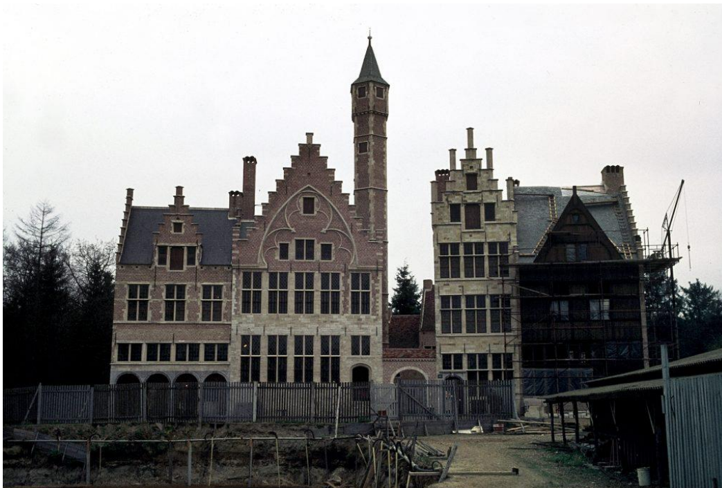
In de jaren zestig werden de gevels van gesloopte stadswoningen uit Antwerpen teruggebouwd in Openluchtmuseum Bokrijk. Opbouwfase Deel 1, Deel 2 vooraan was toen nog niet gerealiseerd. Beeld Marc Dubois (opname jaren 80)

Al het waardevolle dat in landelijke gebieden moest wijken voor een ongebreidelde expansiedrang, werd zorgvuldig afgebroken en weer opgebouwd in Bokrijk, een openluchtpark waar verschillende typologieën van hoeves werden samengebracht die niets met de bestemming van de bodem te maken hadden. Het werd nog gekker toen een gehele stadswijk van Antwerpen verhuisde naar Bokrijk. Vanaf de "pagaddertoren" kan men niet meer de Schelde zien maar de bossen en de oude steenbergen van Limburg.