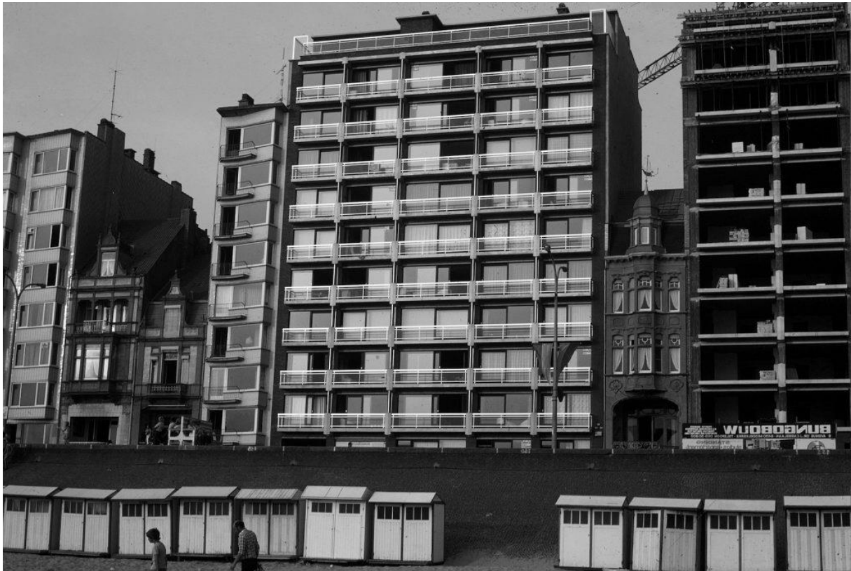
Middelkerke Zeedijk met woning Doris (rechts) Beeld Marc Dubois (einde jaren 90)

ontwierp. Vandaag is dit voorbeeld van een typische vakantiewoning het ENIGE bewaarde gebouw op de gehele zeedijk.