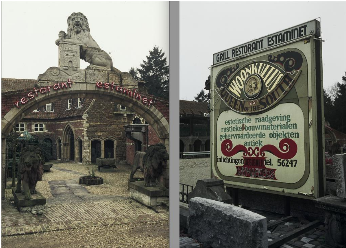
Queen of the South, Bokrijk (Genk), 1972. Op het informatiepaneel (rechts) lees je wat je hier kunt aantreffen en bekomen. Onderaan staat vermeld 'Designer Raymaeckers' (eind jaren 70)