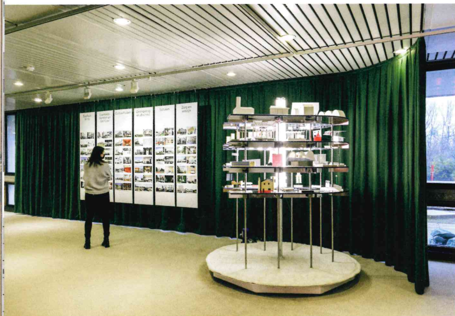
← Open Oproep: 20 jaar architectuur in publieke opdracht