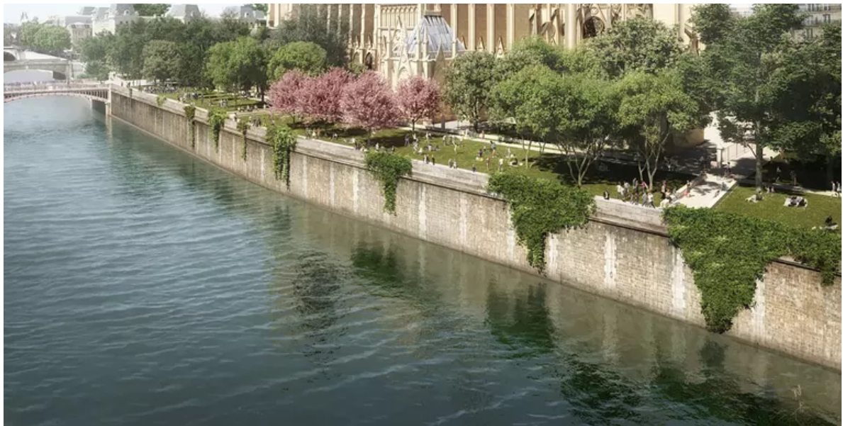
Het ontwerp gezien vanop de Seine.