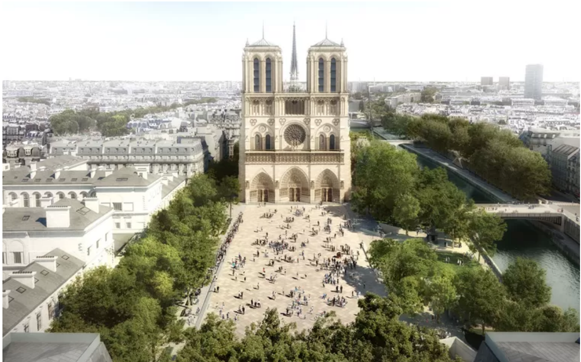
Het ontwerp van Smets.

De onthaalruimte voor de jaarlijkse 12 miljoen bezoekers komt onder het plein, in wat vroeger een parking was. Het past in de visie van Hidalgo op Parijs als ‘vijftienminutenstad’, met alles op fiets- en wandelafstand. Smets ontwerp zal het canvas vormen voor dagelijks tienduizenden vakantiefoto’s, maar de omgeving van de Notre-Dame mag er niet meer enkel voor de toeristen zijn.