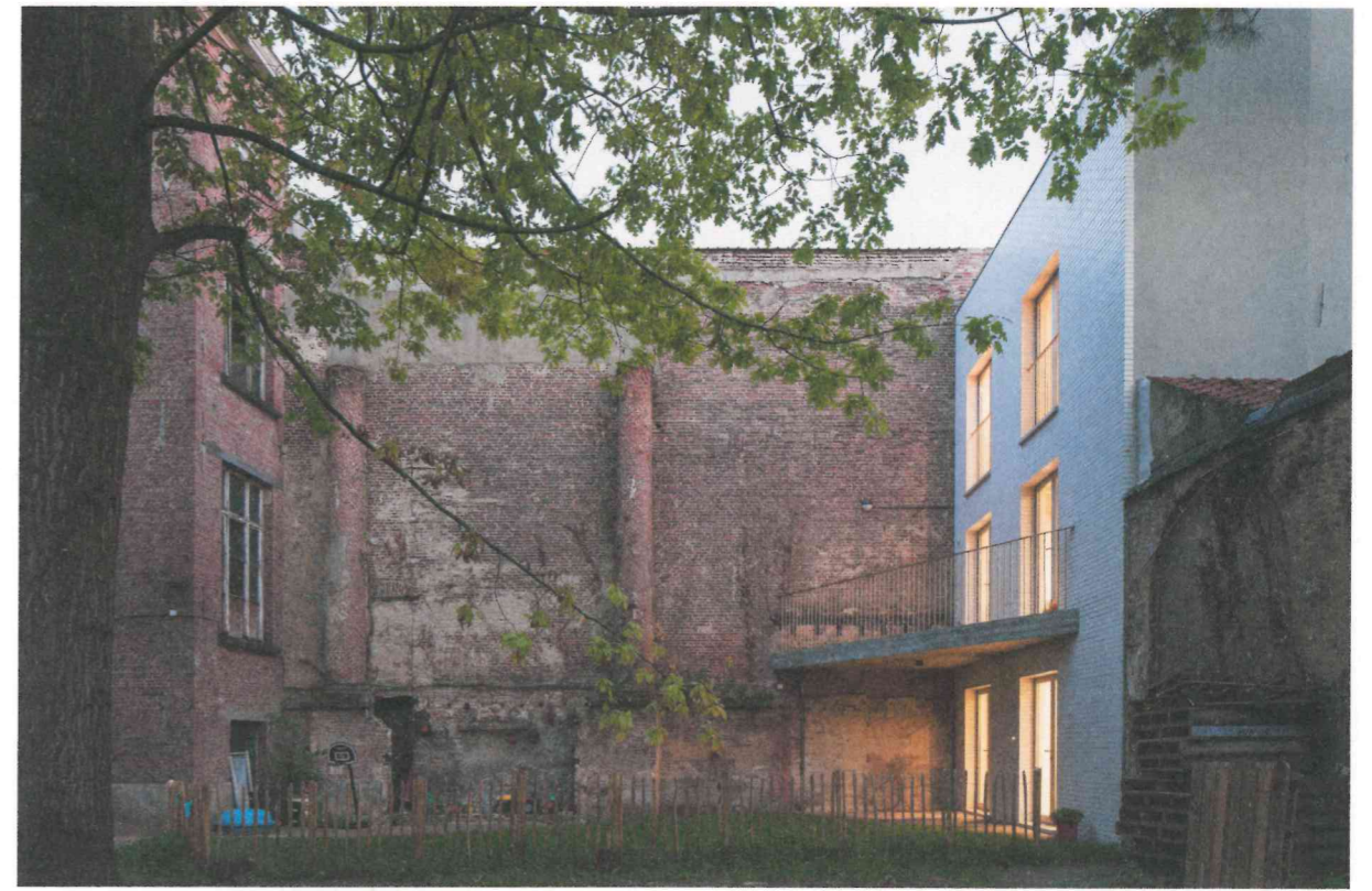
Generiek, Cross House, Gent

Zoals bij de meeste startende architecten bestaat hun architectenpraktijk voornamelijk uit privéopdrachten. Deze universele basisopdrachten beschouwen ze als