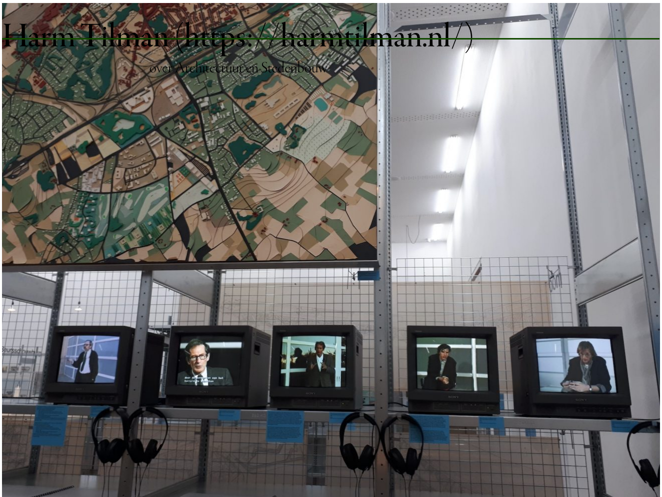
Internationale prijsvraag voor Hoog Kortrijk, 1990

Voor Antwerpen wordt ingegaan op de wedstrijden 'Stad aan de Stroom' (1989-1990) en het MAS (1999-2000). Met veel video's worden de projecten voor Hoog Kortrijk getoond (1990) met de uiteindelijke keuze van Bernardo Secchi & Paolo Viganò. Ook het VAC (Vlaams Administratief Centrum) in Hasselt (1996-1997) en de Beursschouwburg Brussel (1997-1998) zijn het resultaat van een competitie.