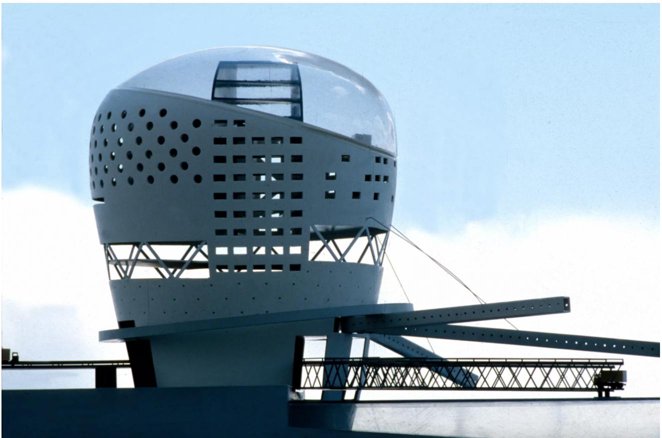
OMA, Zeebrugge Sea Terminal, prijsvraagontwerp 1988

“Deze vorm van mededinging is zodanig dat hij zich opdringt aan iedere onpartijdige geest ..... hij verzekert, inderdaad, de juiste verdeling der werken van openbaar nut onder alle architecten en ingenieurs. Hij laat daarenboven aan kunstenaars en technici met vooruitstrevende strekking toe, zich vrij uit te spreken.”