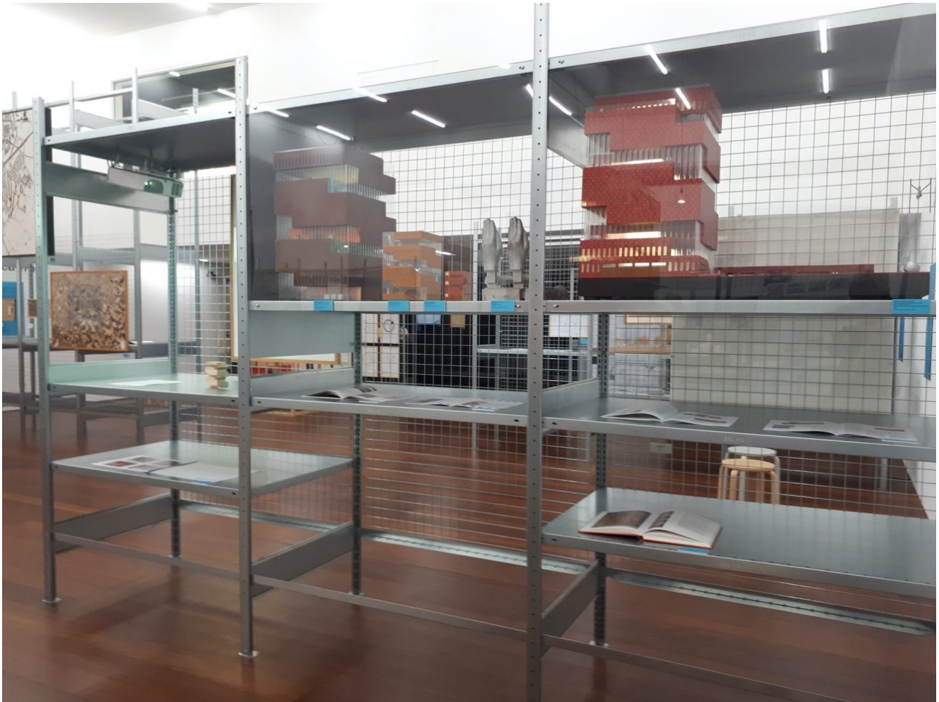
Pijsvraag voor het Museum aan de Stroom, Antwerpen 1999-2000