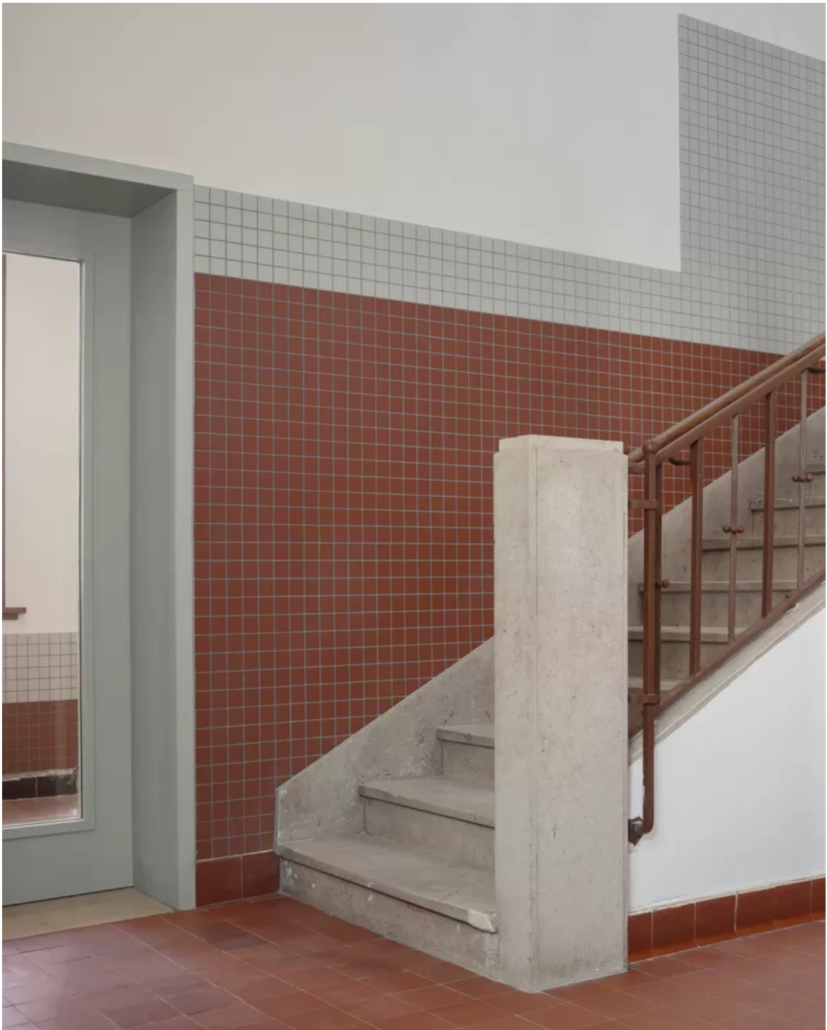
Cadix Scholencampus in Antwerpen.

In Nederland maken architecten meestal alleen een voorlopig ontwerp; daarna zijn ze slechts zijdelings bij het project betrokken, wat volgens Stuhlmacher ‘enorm scheelt in de kwaliteit van de uitvoering’. Concreet betekent het dat architectuur in die eindfase vaak wordt wegbezuinigd.