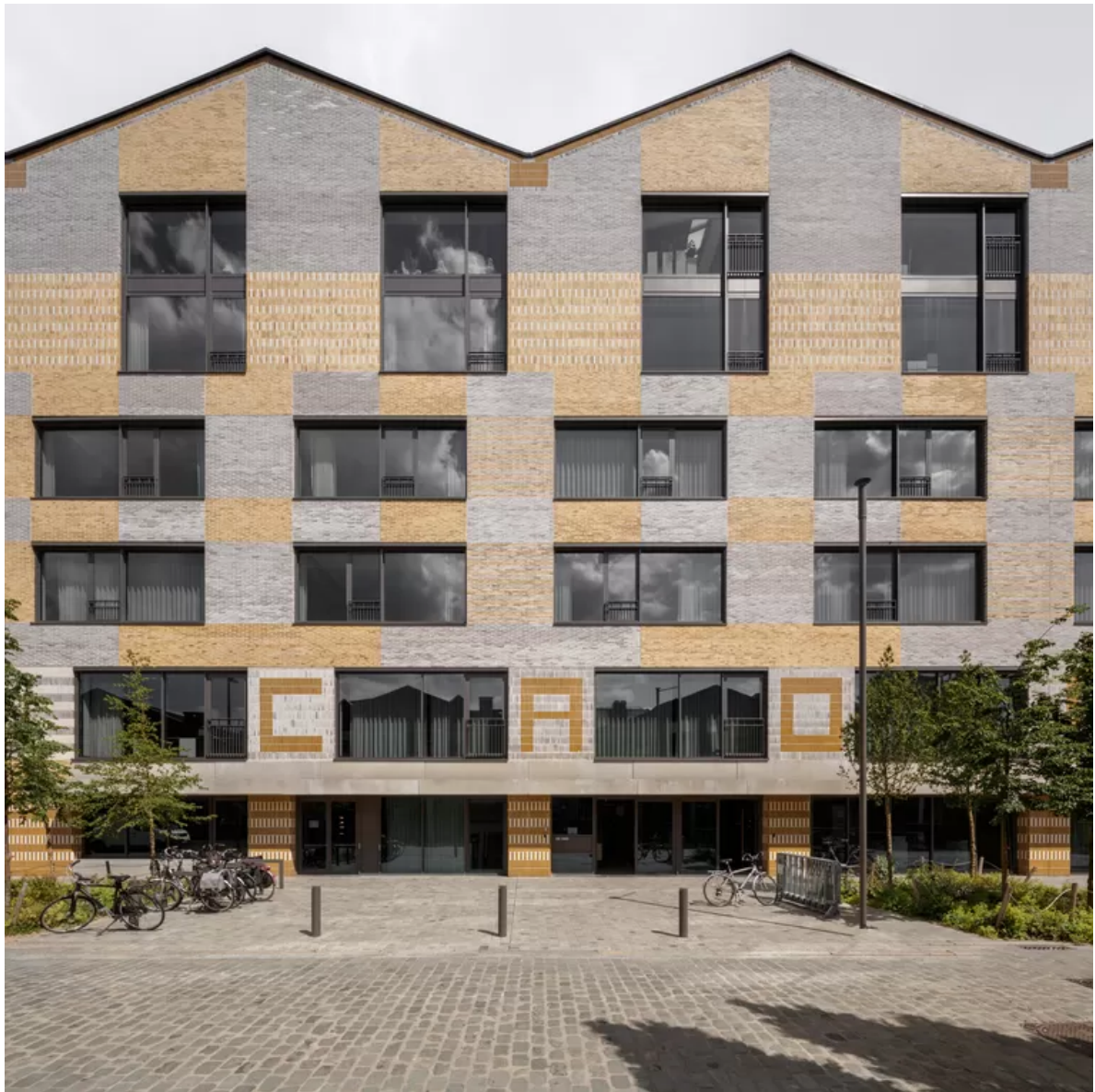
Cadix Scholencampus in Antwerpen.

In Vlaanderen werkt Korteknie Stuhlmacher aan een hele reeks schoolprojecten, die het bureau verwierf via de Open Oproep van de Vlaams Bouwmeester, die het architectuurbeleid in Vlaanderen vormgeeft. Bij dit prijsvraagstelsel, ontwikkeld voor publieke opdrachtgevers, staat de kwaliteit van het plan voorop. Het honorarium is vooraf vastgelegd, en er gelden geen referentie- of omzeteisen voor architecten; die worden gekozen op basis van hun portfolio, waardoor ook unusual suspects kans maken.