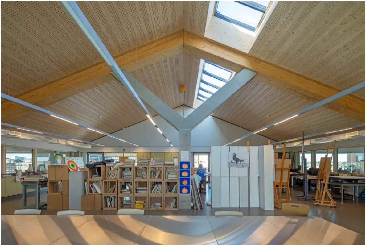
Cadix Scholencampus in Antwerpen.

Aan de Nieuwe Dokken in Gent, het voormalige havengebied dat wordt herontwikkeld tot een nieuw stuk stad, staat een gebouw als een enorme ‘apenkooi’. Kinderen klauteren over trappen en hellingbanen omhoog, roetsjen via glijbanen naar beneden, rennen over het sport- annex dakterras en wroeten met hun handen in de moestuin waaruit planten langs de stalen gevelconstructie omhoog klimmen.