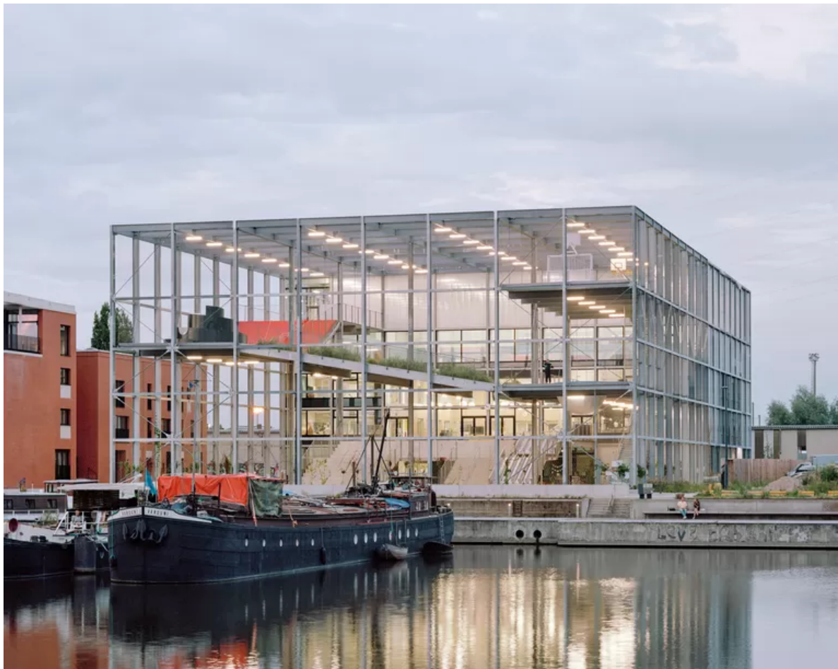
Melopee-school in Gent.