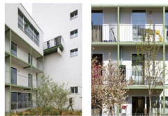
DEEY architecten (Stromendek Bende-Laan-Van De Ghent)