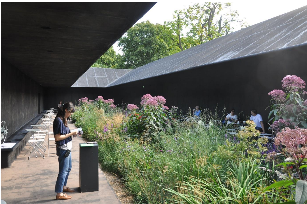
Londen, Serpentine paviljoen 2011 "Hortus Conclusus / architect Peter Zumthor