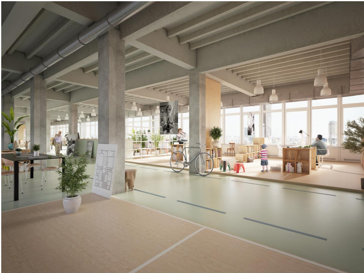
ontwerp interieur Oudaan

De tentoonstelling BWMSTR Label. We kopen samen den Oudaan toont ontwikkelingsmogelijkheden voor de Oudaan en stimuleert tegelijkertijd het maatschappelijk debat over nieuwe vormen van publieke ontwikkeling, cofinanciering en gedeeld ruimtegebruik. Workshops en een reeks publieke debatten maken van de tentoonstelling een 'living lab' waarin de curatoren 3 maanden lang ruimte bieden voor uitwisseling en experiment. Met verschillende partners werken ze een business case uit voor een Open Promotor Platform (OPP), een instrument om stedelijke ontwikkeling toegankelijk te maken voor alle actoren in de maatschappij met als einddoel de Airbnb , Uber of Etsy te worden van de vastgoedmarkt. Het resultaat van deze oefening zal te zien zijn tijdens de finissage op 11 januari 2017.