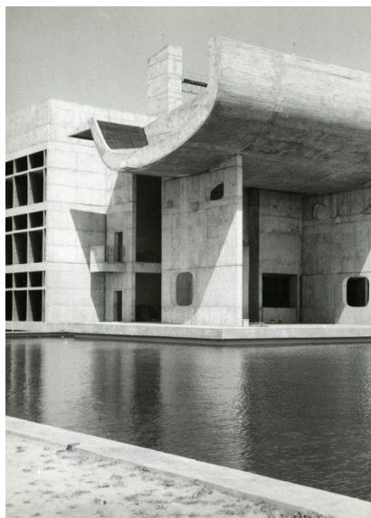
Foto's gemaakt door Léon Stynen bij zijn bezoek aan Chandigarh in 1963 (Privé-archief familie Stynen)