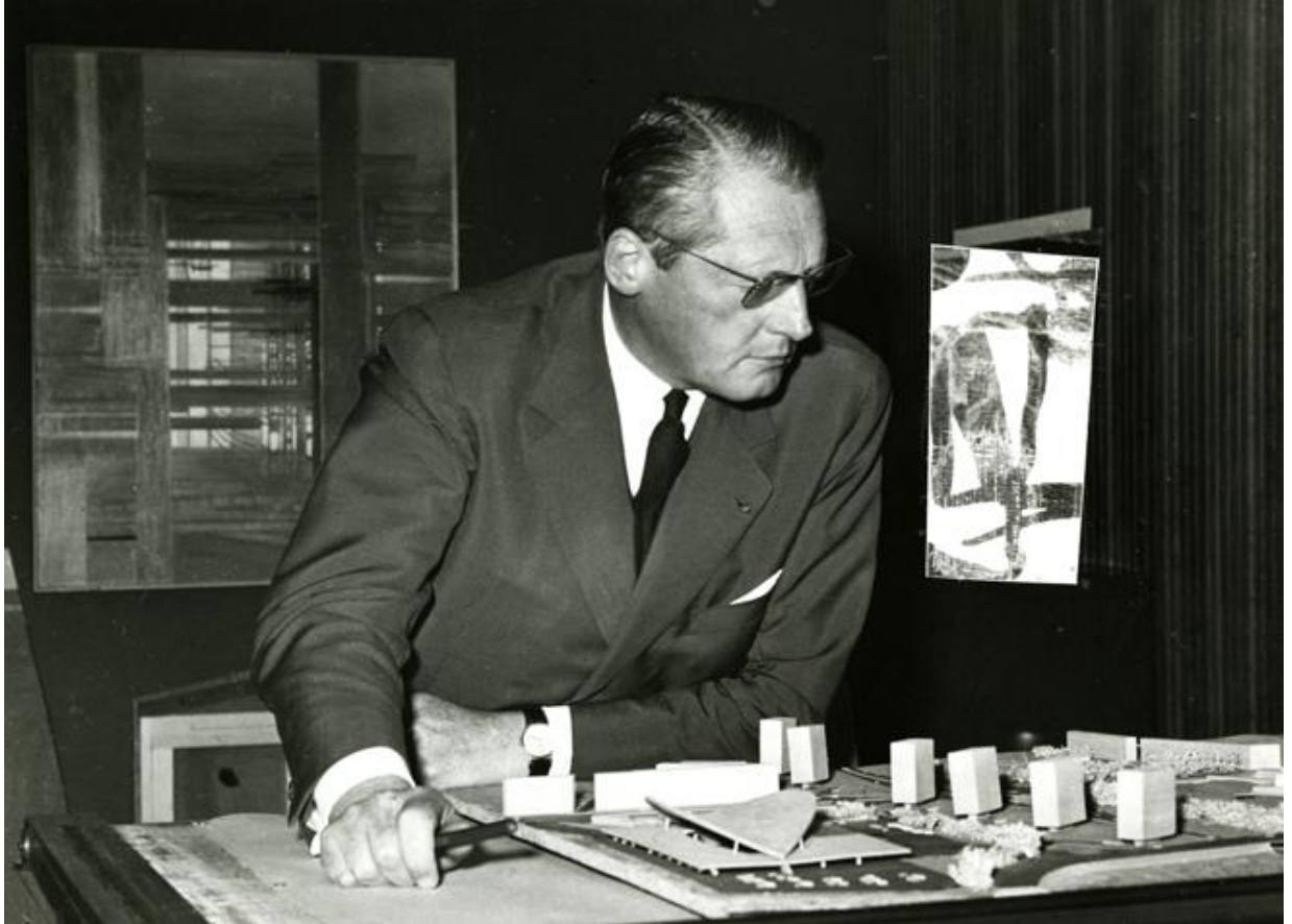
Léon Stynen met de maquette voor het economisch centrum aan de Wezenberg in Antwerpen, circa 1969