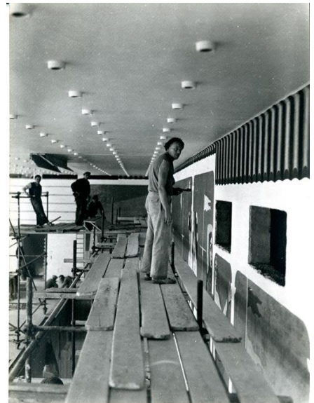
Paul Delvaux tijdens de uitvoering van zijn wandschildering in het casino van Oostende, circa 1952