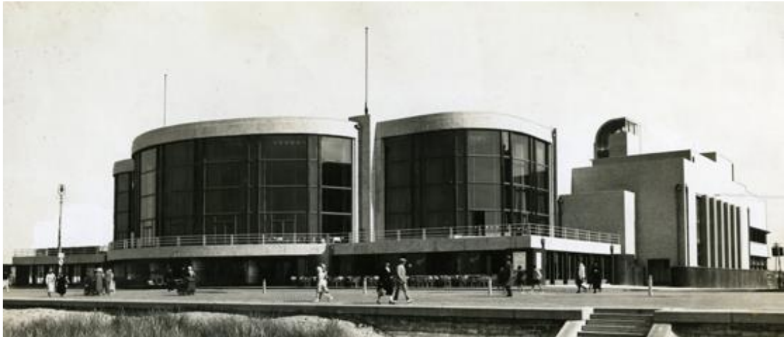
Casino Knokke, 1929-1931, Léon Stynen

Stynen startte zijn carrière met een aantal wedstrijdontwerpen in een Berlagiaanse stijl, zoals een oorlogsmonument in Knokke (1921). Intussen bouwde hij cottages en art-decowoningen, -winkelhuizen en -appartementengebouwen in Antwerpen, Brussel en Knokke. Vanaf midden jaren 1920 verdiepte Stynen zich in de ideeën en de realisaties van de avant-garde en trachtte die in een Belgische context te verwezenlijken. Met zijn ontwerp voor het casino van Knokke (1928) koos hij resoluut voor het modernisme. In de woningen, appartementengebouwen, cinema's, scholen, rustoorden en kantoorgebouwen die hierop volgden, putte hij volop uit het jargon van het 'nieuwe bouwen'. Op de Antwerpse wereldtentoonstelling van 1930 voerde hij enkele markante projecten uit, waaronder het paviljoen De Decoratieve Kunsten en paviljoen De Beukelaer. Hoogtepunten in deze periode waren de Elsdonckresidentie in Wilrijk (1933) en het rustoord Hof ten Bos te Brasschaat (1937). Te vermelden zijn ook nog zijn eigen woning in de Tentoonstellingswijk in Antwerpen (1932) en de cinema Rex (1934).