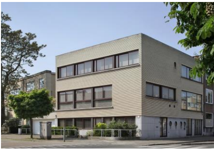
Huis Stynen, Expowijk Antwerpen, 1932, Léon Stynen

Diverse locaties in Antwerpen, najaar 2018