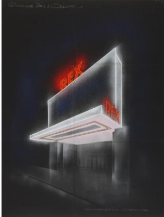
Cinema Rex, 1935, Léon Stynen in samenwerking met Jan De Braey, Antwerpen