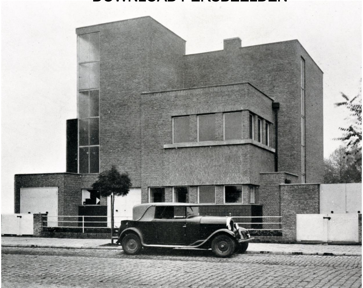
Woning Verstrepen, Léon Stynen, Boom, 1927