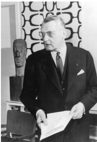
Léon Stynen als directeur van het Hoger Instituut voor de Sierkunsten Ter Kameren (1950-1965)