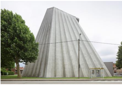
Parochiekerk Sint-Rita, 1961 en 1968, Léon Stynen i.s.m. P. De Meyer

Diverse locaties in Vlaanderen, 9 sept 2018